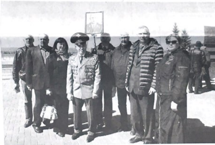
Ветеранский актив ГУ МВД в памятные дни Воинской славы России традиционно возлагает цветы к Вечному огню на Площади Славы областной столицы. Фото от 6 мая 2022 года.

Курская битва, длившаяся с 5 июля по 23 августа 1943 года, стала одним из ключевых сражений Великой Отечественной войны. В ней участвовало с обеих сторон более 4 миллионов человек, были задействованы почти 70 тысяч орудий, свыше 13 тысяч танков и самоходных орудий, 12 тысяч боевых самолетов. Воевали на Курской дуге самолеты Ил-2, которые изготавливались в Куйбышеве. После победы в сражении стратегическая инициатива окончательно перешла на сторону Красной армии, которая впоследствии проводила в основном наступательные операции. В Курской битве героически сражались жители Самарской области.