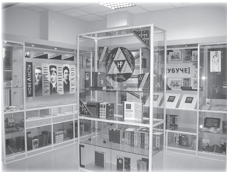
Выставка «КубУЧе. Геометрия малой формы»

И скусство – одно из приоритетных направлений деятельности сармской модельной библиотеки № 8. Здесь успешно реализуется театральный проект «Сцена 8». Недавно к нему добавился новый просветительский проект «Диалоги об искусстве». В его задачи входят: ближе познакомить участников с известными мастерами, по-новому представить их творчество, рассказать об актуальных направлениях живописи, музыки, литературы разных лет. При этом мы стараемся рассмотреть «живые» темы искусства, проследить их влияние на современную действительность, вовлечь в творческую среду юные таланты, заинтересованную молодёжь.